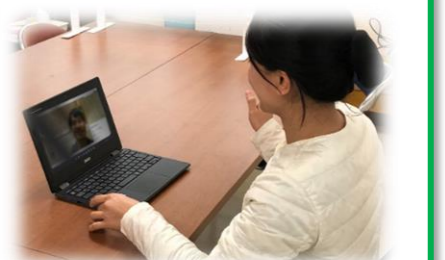
オンラインによる英会話レッスン