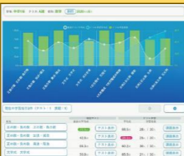
学習ドリルソフト